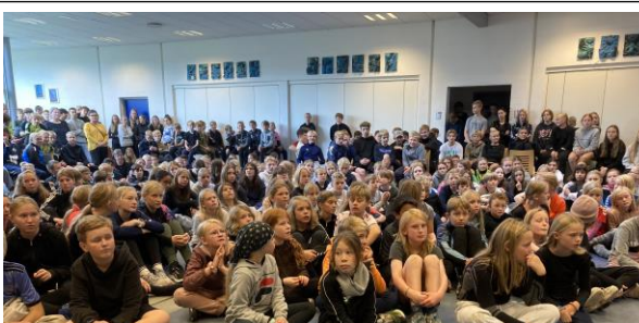
Eleverne fra 6. – 9. var samlet for at hylde deres kammerater, der vandt medaljer.