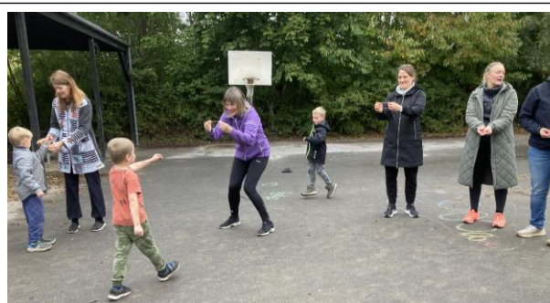
Hver omgang udløser et elastik, så klassen bag efter kan se, hvor mange omgange de har løbet.