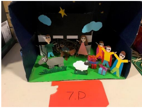
Vinder af det "Mest moderne" krybbespil 7.D