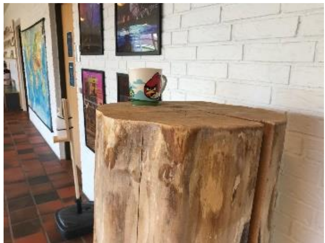
Hmmm... mon det er en udstilling eller blot Dorte, der har glemt sin kop!?! 😊