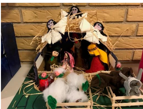
Vinder af konkurrencen 4.C

I år blev der udskrevet en konkurrence, om at lave et krybbespil med en skotøjsæske som mål. Derudover blev der lagt op til at klasserne kunne nyfortolke krybbespillet, og der var bestemt mange sjove og flotte bud på krybbespil. Der er selvfølgelig æbleskiver og kakao til de vindende klasser!