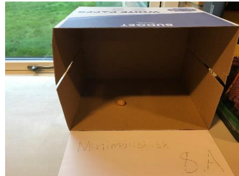
Rosende omtale til 8.A for at være kreative, men en præmie kan det ikke udløse.