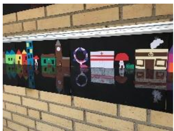
Et bud på genspejlinger af papirclip, lavet i billedkunst.