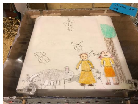
Vinder af "Mest kreative fortolkning" 2.A