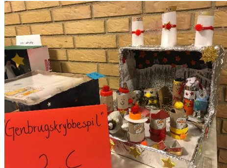
Vinder af "Klima Prisen" 2.C