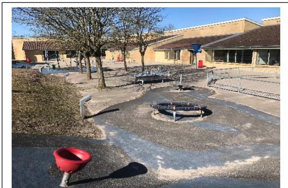
En helt tom skolegård, det virker forkert.

ugeplanen bliver dannet), gøre oplysninger let tilgængelige og for mange læreres vedkommende samtidig med at de selv har skullet passe deres børn.